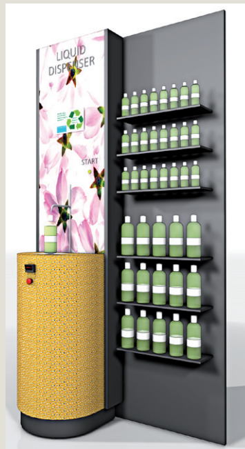
Unterschiedliche Gestaltungsvarianten sind möglich

umdasch Liquid Dispenser as a standard single solution