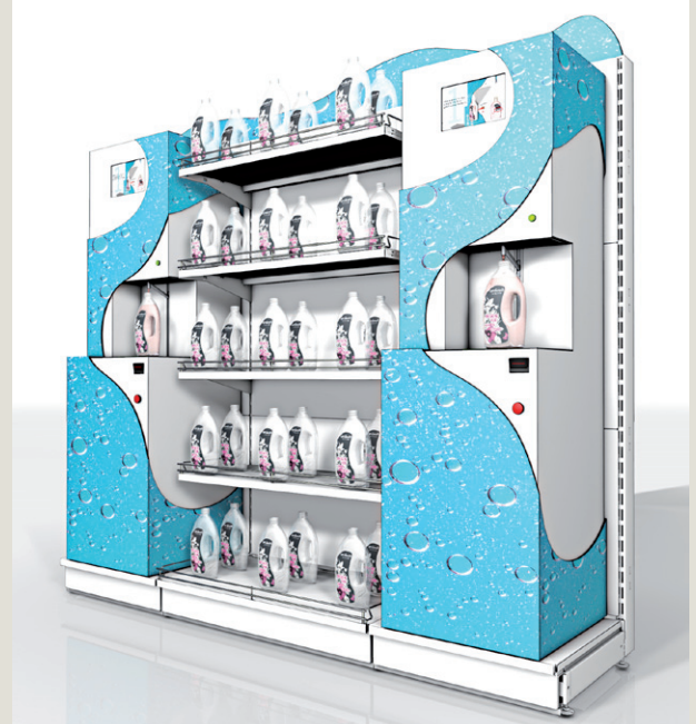
Die Vollintegration in bestehende Regaleinheiten ist besonders platzsparend und effizient

Complete integration into existing shelf units is particularly space-saving and efficient