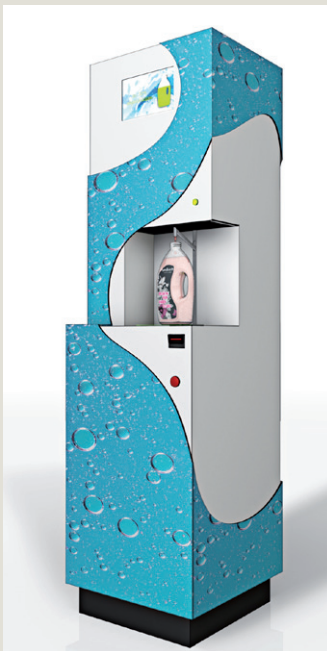
umdasch Liquid Dispenser als Standard-Singellösung

umdasch Liquid Dispenser as a standard single solution