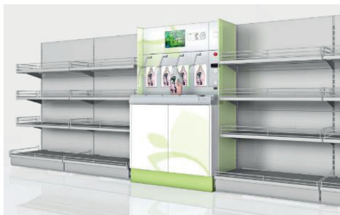
umdasch Liquid Dispenser als Nachfüllstation im Regalverbund integriert