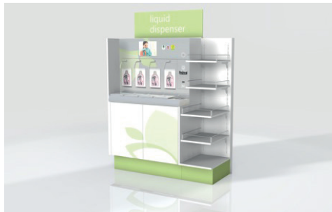
umdasch Liquid Dispenser als Gondelkopflösung freistehend