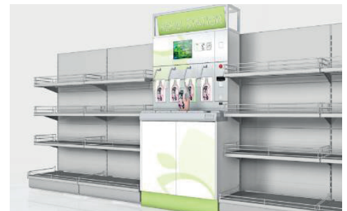
umdasch Liquid Dispenser als Nachfüllstation im Regalverbund integriert mit Crowner Lösung